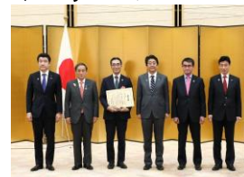
第2回「ジャパンSDGsアワード」授賞式