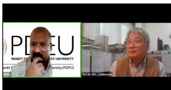
澁澤栄連携会員(パラレルセッション6議長)