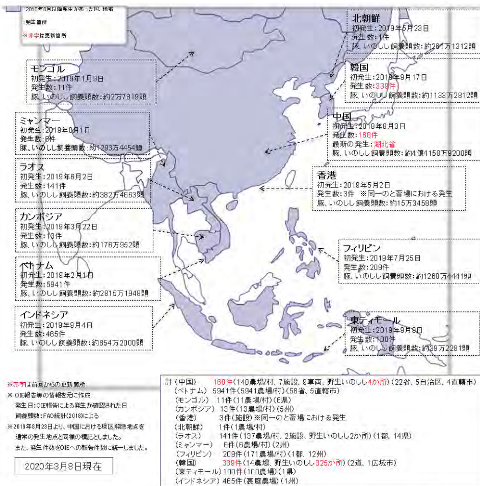
図1 アジアにおけるASFの発生状況(2020年3月8日現在) 農林水産省資料より

ASF (African Swine Fever: アフリカ豚熱, 旧名称: アフリカ豚コレラ) は、代表的な越境性動物疾病である。ASF はウイルスによる豚・イノシシの熱性伝染病で、強い伝染性と高い致死率を特徴とする。従来はアフリカサハラ以南での常在疾病であったが、2007年にジョージアに侵入し、コーカサス地方ならびにロシアに拡大した。その後、世界最大の養豚国であり世界の半数以上豚肉消費国である中国に侵入し[1、2]、アジアの周辺国へも広がっている (図1)。幸い、我が国への侵入は2020年X月X日現在確認されていないが、渡航者が不法に持込む豚肉加工品から感染性ウイルスが摘発されている。