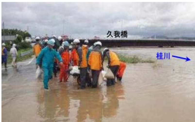
写真 1 2013年9月の台風18号による洪水では桂川右岸の堤防で越水が生じた（出典：参考資料 [8]）

また、大規模自然災害をもたらす豪雨は大洪水を発生させるだけではない。2011年の熊野川の豪雨災害で多数の深層崩壊を生じさせたように社会的にも経験の少ない災害事象を引き起こす可能性がある。これらに対しては対応策が確立されていないものも多く、自然外力の量的な増大への対応とともに、対応策の検討が急がれる。