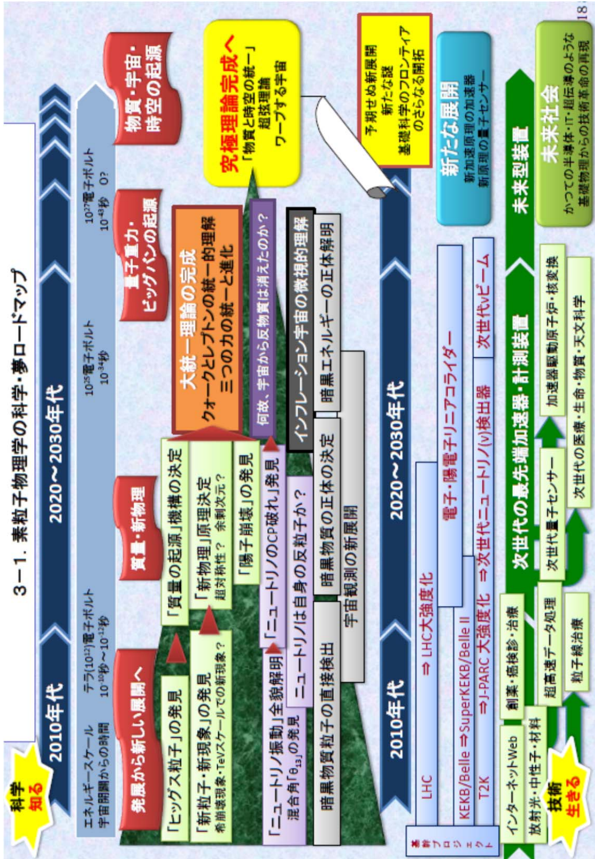
〈参考資料3〉 「理学・工学分野の科学・夢ロードマップ」(2011年8月24日)より抜粋 (素粒子物理学分野の科学・夢ロードマップ)