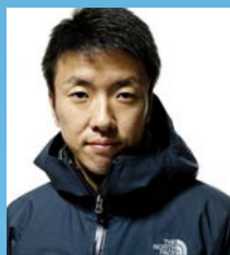
石川 直樹氏 写真家

北極の気候変動は富山の自然をどう変えるのか。 私たちになにができるのか。一緒に考えてみませんか？