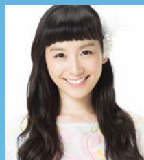
篠原 ともえ氏 [司会・進行] タレント・アーティスト