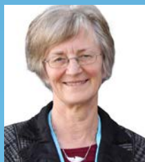
スーザン パール氏 国際北極科学委員会 (IASC) 議長 / 極域歴史家