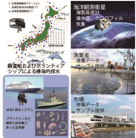
図1. 海洋生態系ビッグデータ収集

生態系ベースの水産資源管理の重要性は国際的に認識されているが、その実現のための科学的実績は乏しい。次世代シーケンサが開発されて以来、ゲノム・メタゲノム・eDNA解析が発展し、海洋生態系の生態系種間相互作用を解き明かす上でブレークスルーとなる情報を提供するものと期待されている。しかしこのDNAを基盤とした取り組みにおいても、従来の内外の成果は広域な海洋生態系の把握各種相互作用の解明には不十分である。本提案は、これまで不可視であった海洋生態系の構成要素を可視化する初めての試みである。海洋物理、海洋化学、生物生態、DNA情報を含むビッグデータを有機的に紐づけることによって、海洋生態系の保全と海洋生物資源の持続的利用を図る体制「海洋生物資源ガバナンス」の構築は、世界初のモデルケースとなる。