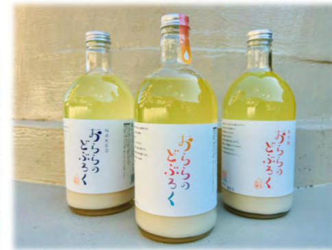
R1商店街活性化補助金