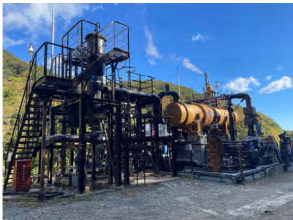
温泉バイナリー発電所

源泉を活用した地熱発電の一種。 「稼ぐ地域」と「インフラ観光」という2つの新たな価値を展開するためのキラークンテンツとして整備。