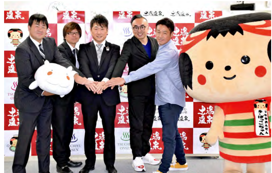
BI 4組・AMB 1名からスタートしたプレスリリース時の模様