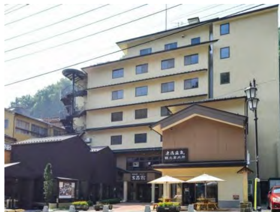
まちおこしセンター 湯楽座（ゆらくざ）

（廃旅館を再生） 観光案内所・地場産品販売コーナー レストラン・ギャラリー 地域交流室・会議室 研修室・研修宿泊室 etc