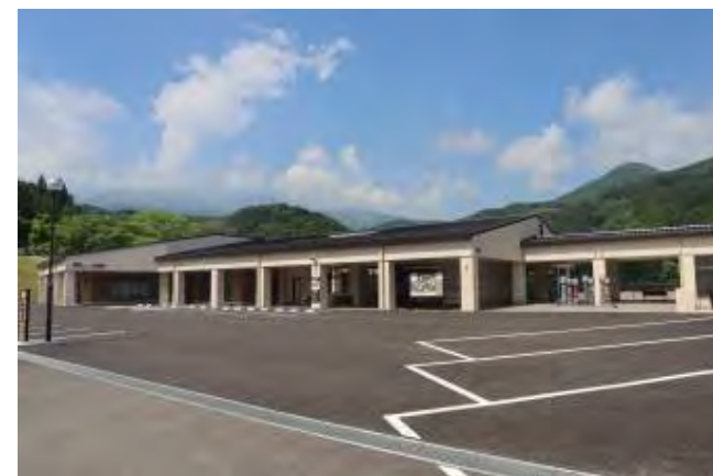
観光交流センター 湯愛舞台（ゆめぶたい）

（廃旅館を再生） 大駐車場・観光インフォメーション こけし展示制作体験コーナー コンベンションスペース 展望広場 etc