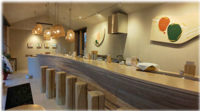
R1商店街活性化補助金