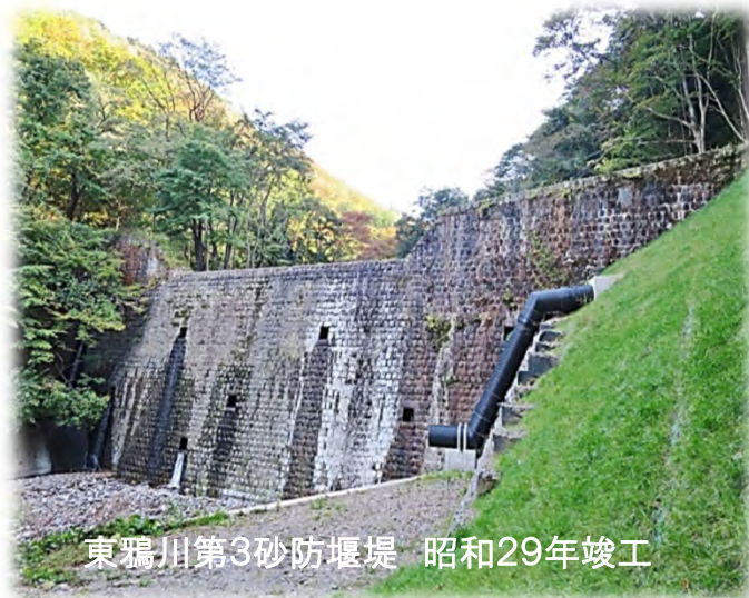
東鴉川第3砂防堰堤 昭和29年竣工