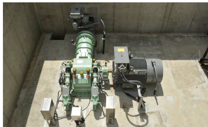
東烏川 小水力発電所

国交省の直轄砂防地域に認定されており、100年余の歴史を有し、国の指定重要文化財にも指定されている土湯温泉の「砂防堰堤」を活用。