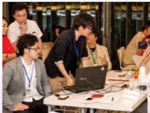
ベンチャーコミュニティ