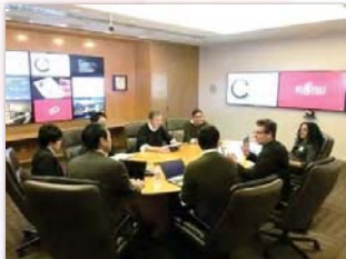
Open Innovation Gateway