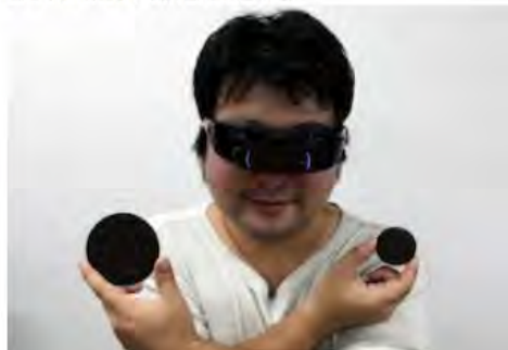
図 2 (a) 「ダイエットも情報から」の一部

食品を認識 し、その大きさを替えて提示することで満腹感を意識せずに制御し、食行動を改善する。