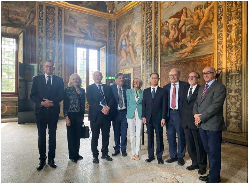
各国アカデミー代表