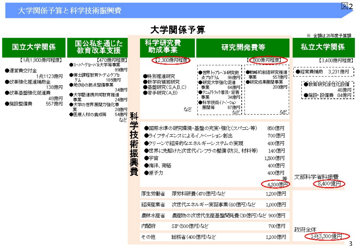
<付録図表 2> 大学関係予算と科学技術振興費