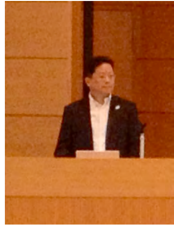
ご来賓：板倉康洋文科省 ライフサイエンス課長