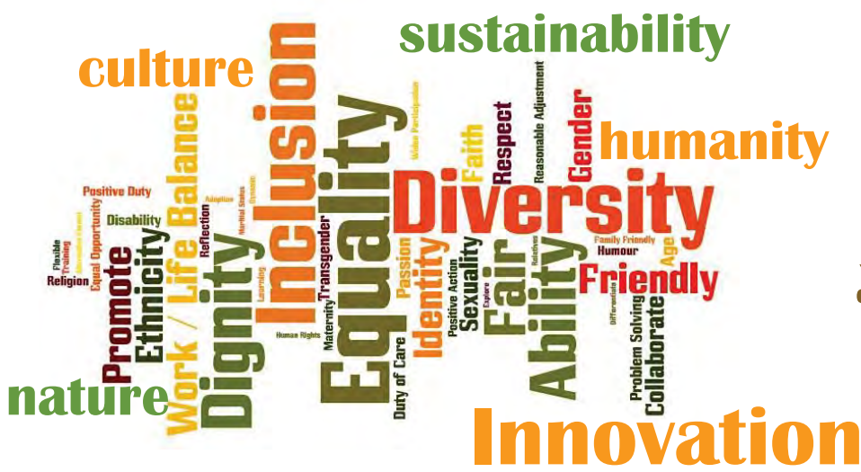
Part of Image Below Retrieved 10 April 2019 from: https://www.google.com/search?q=inclusion&source=Inms&tbn=isch&sa=X&ved=0ahUKewj4-5DEm8XhAhVPfXAKHbvTDqIQ_AUIDygC&biw=1368&bih=802&dpr=2#imgsrc=kqmbCxc1i0SQ0M: