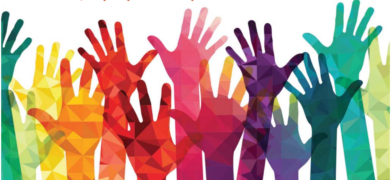
Image above retrieved on 10 April 2019 from https://www.google.com/search?q=inclusion&source=Inms&tbn=isch&sa=X&ved=0ahUKewj45DEm8XhAhVPfXAKHbvTDqIQ_AUIDygC&biw=1368&bih=802&dpr=2#imgsrc=os_cTeUJMuSobM:

Inclusive Innovation, Reciprocity and Generosity as the foundation for Transnational Collaboration