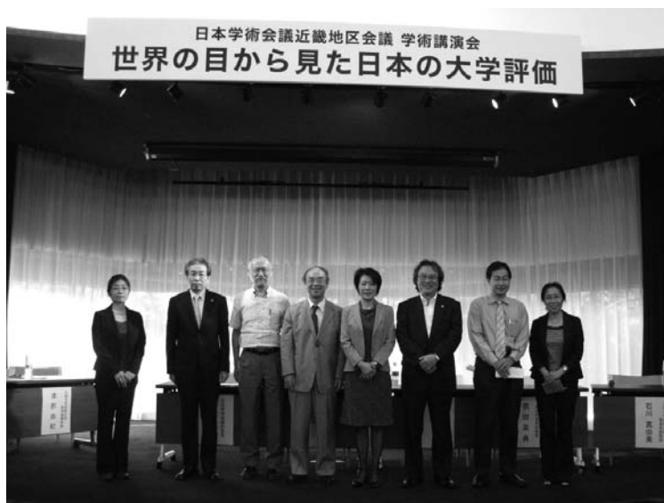
学術講演会講演者の集合写真

世界大学ランキングは2003年に上海交通大学が発表したARWU世界大学ランキングに始まり、THE、QSと様々なランキングが出現した。高等教育市場のグローバル化時代の到来で、世界大学ランキングへの関心は高まっている。その一方で、大学の番付表作りが主目的の世界大学ランキングが学生の大学選択や大学の質保証・向上の情報源として使用される状況から、その信頼性への懸念が高まっている。ユネスコ・ヨーロッパ高等教育センターと米国の高等教育政策研究所により結成された国際ランキング専門家グループが世界大学ランキングの評価を実施することを発表した。教育、研究、社会貢献と多様な役割を持つ大学をどのような基準で評価しているのか、また評価方法は妥当なのか議論を呼んでいる。主要な世界大学ランキングの評価指標と評価方法を比較し、世界大学ランキングの傾向について考察する。 [文責：苧阪直行]