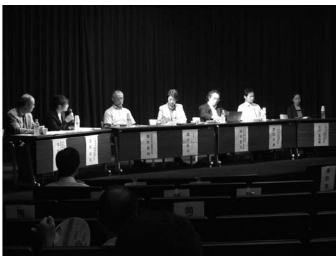
講演会にて総合討論を行う講演者

なお、終了後に講演会参加 113 名の方々からアンケート調査に回答いただき、そのうち 48 名の集計によると、参加者は世代別では 20-60 歳代でほぼ均等、85% は大学と研究機関関係者であった。